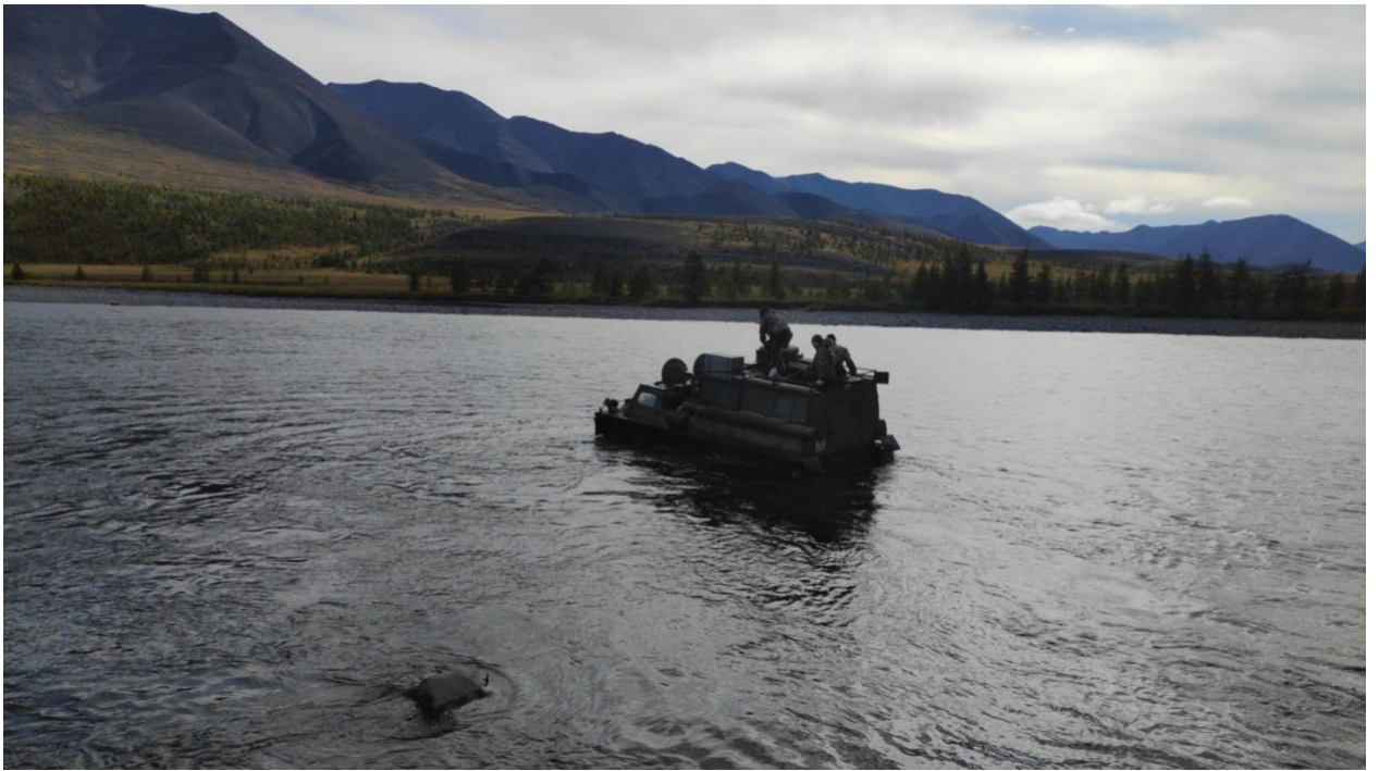
Рис.14. Переправа через реку при проведении маршрутного учёта.

Оценить величину пропуска снежных баранов при визуальных наземных учётах сложно, но, очевидно, она составляет не менее 20 - 30%. Применяв данный процент пропуска, численность снежного барана на обследуемой территории определена в размере 280-300 особей; плотность населения – 8,7-9,3 ос./1000 га (в среднем 9,0 ос./1000 га). Данные цифры согласуются с результатами исследований 2021 г. Высокая плотность населения снежного барана не распространяется на высокогорную часть обследуемой территории, расположенную на южной оконечности хребта, примыкающей к хребту Орулган. По нашим наблюдениям примерно за 15 км до перевала, расположенного на стыке хребтов (на перевале находится озеро, из которого вытекает р. Унгуостах), снежные бараны перестали встречаться. Также отсутствовали тропы этих животных. Встреченные по пути оленеводы, идущие с перевала, сообщили, что снежных баранов не встречали и что в этом месте животные крайне редки.