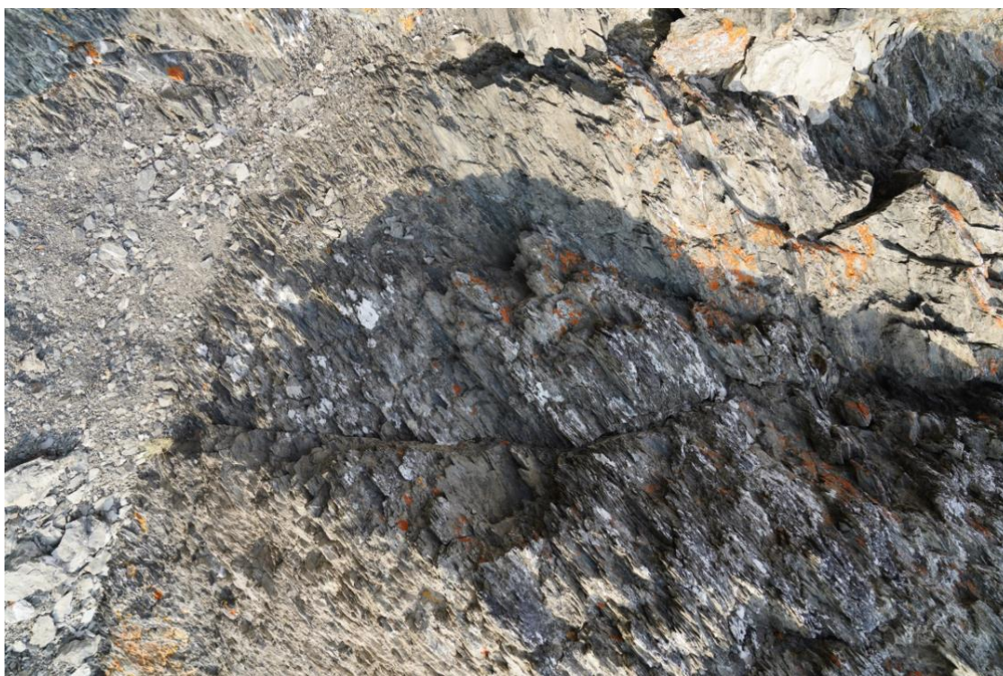
Рис. 17. Солонец на Сасыре.

Как на Ньюосу, так и на Сасыре места отлова были приурочены к естественным солонцам. Каково их значение в жизни снежных баранов требует более углублённого изучения. Солонцы представляют собой беловатые отложения на камнях и имеют чуть уловимый кисловато-соленый вкус, но заметно отличаются от обычной натриево-калиевой соли (рис.17). Постоянно их снежные бараны не посещают, но вблизи солонцов концентрации животных выше.