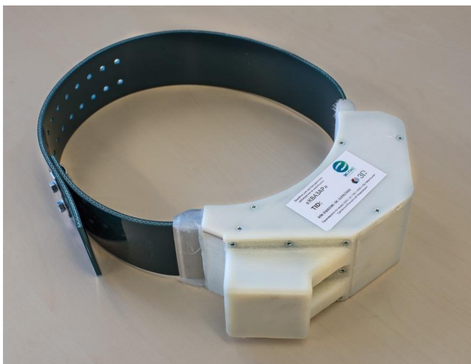
Рис. 9. Радиоошейник «Квазар».

Для мечения животных применялся радиошейник «Квазар», позволяющий дистанционно через спутниковую связь отслеживать перемещения животных (рис. 9 и табл. 1).