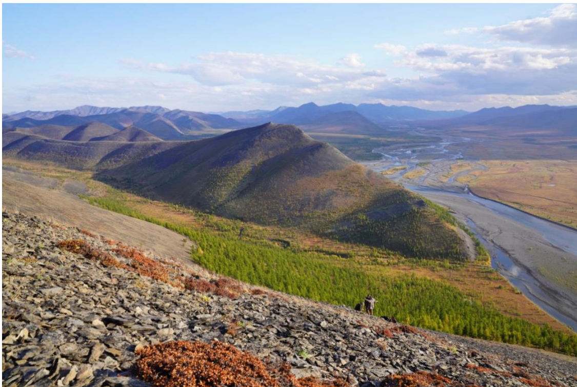
Рис. 16. Горные массивы в окрестностях долины р. Хара-Улах.

лишь по горным массивам, лежащим вдоль относительно широкой и протяжённой долины р. Хара-Улах, вся остальная территория Хараулахского хребта почти не исследована (рис.16).