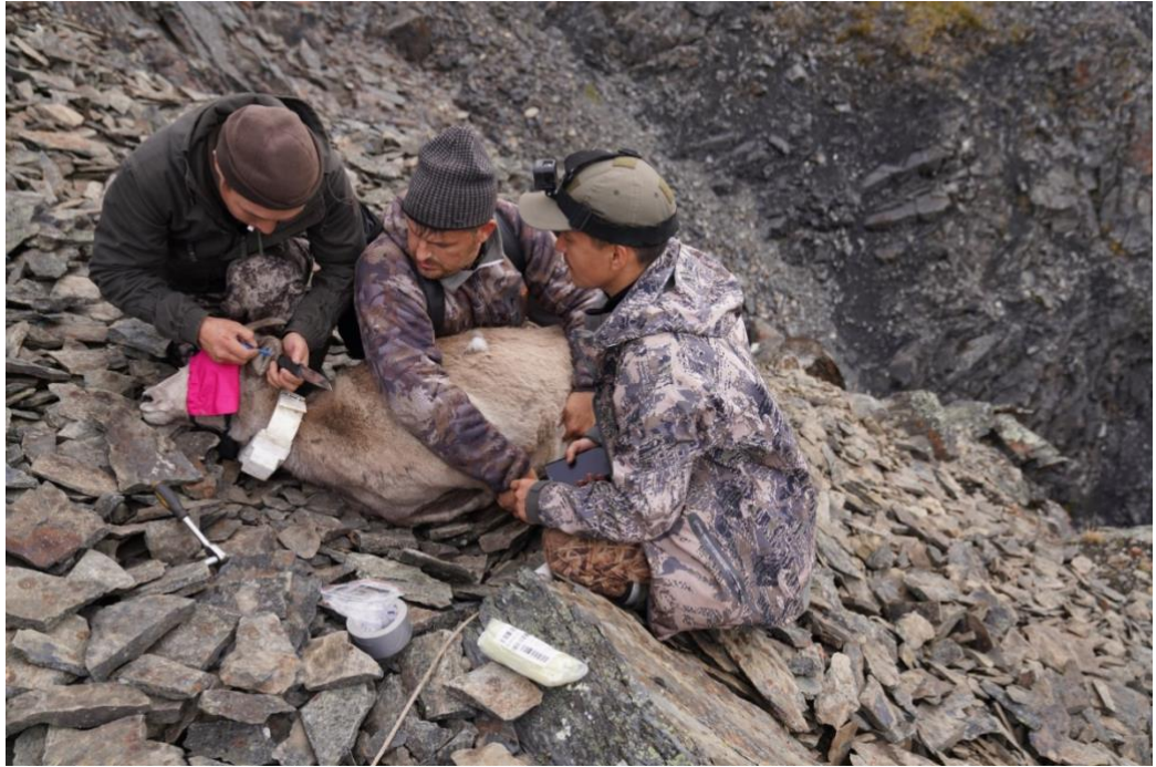
Рис. 18. Мечение снежного барана радишейником.