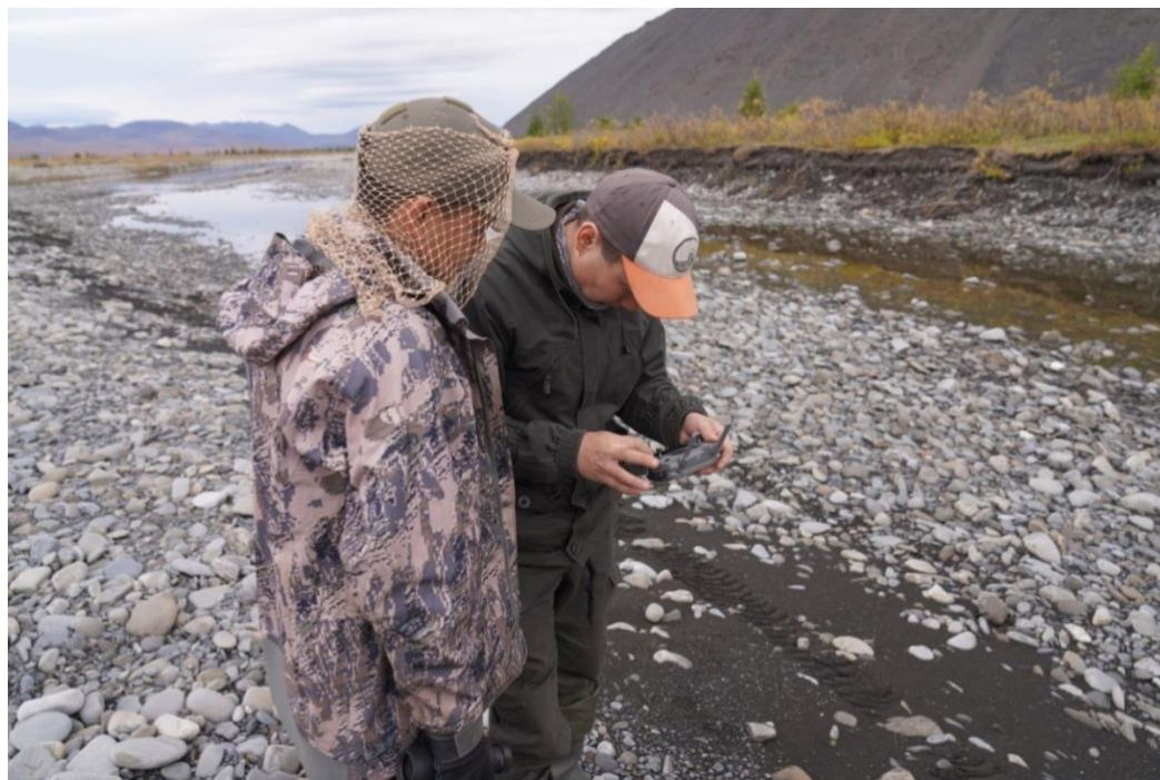
Рис. 7. Наблюдение мест установок ловушек с помощью квадрокоптера.

Слежение за местами установки ловушек осуществлялось в течение светлого времени суток с наблюдательных точек с помощью биноклей и подзорной трубы. Те места, что плохо просматривались с точек, обследовались с помощью квадрокоптера (рис.7 и 8).