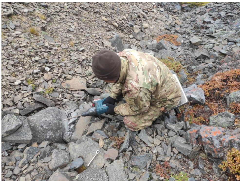
Рис.6. Крепление ловушки к камню с помощью перфоратора.