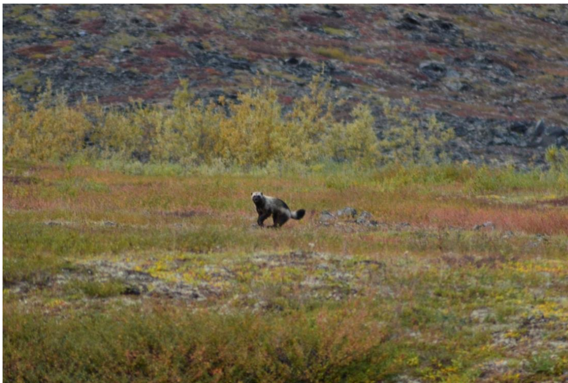
Рис. 22. Росомаха.

барана этот зверь обычен. Росомаху участники экспедиции наблюдали в лагере на Ньюосу (рис.22).