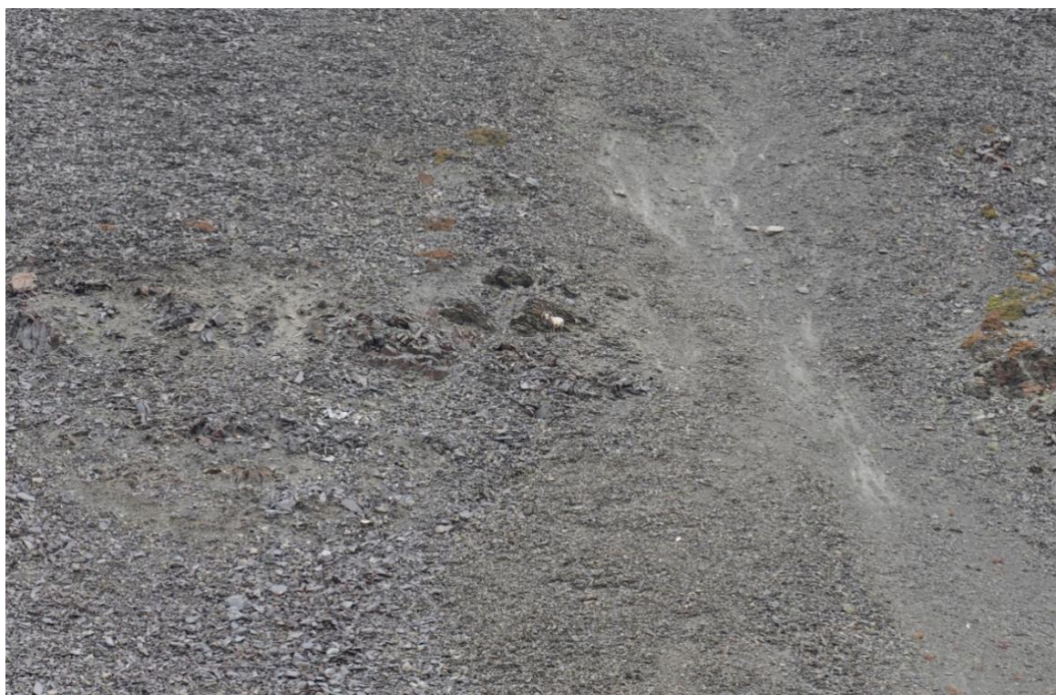
Рис.12. Крупный одиночный самец снежного барана, учтённый на маршруте с вездехода.

Недостатком способа учета с помощью транспортных средств является большой пропуск животных. При использовании биноклей с высокой кратностью (от 10 и выше) увидеть снежного барана при движении вездехода сложно, особенно одиночных и неподвижных животных, поэтому во время езды учётчиками бинокли почти не применялись. Движущегося транспорта, если он находится на удалении, снежные бараны не боятся (рис.12 и 13).