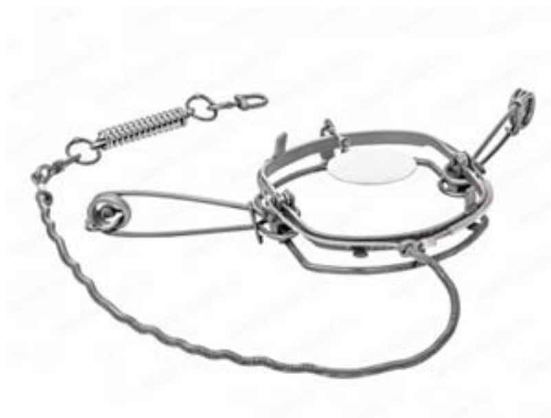
Рис. 4. Ловушка на базе капкана Сибирь-М с ногозахватным тросом.

Для отлова снежных баранов использовались ловушки, представляющие собой капкан (на базе капкана Сибирь-М №5) с прикреплённым к нему ногозахватным тросом d=4 мм (рис. 4).