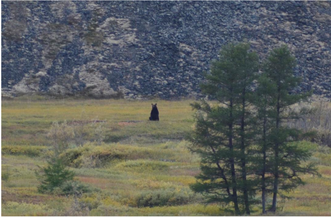
Рис. 20. Бурый медведь, встреченный на маршруте.