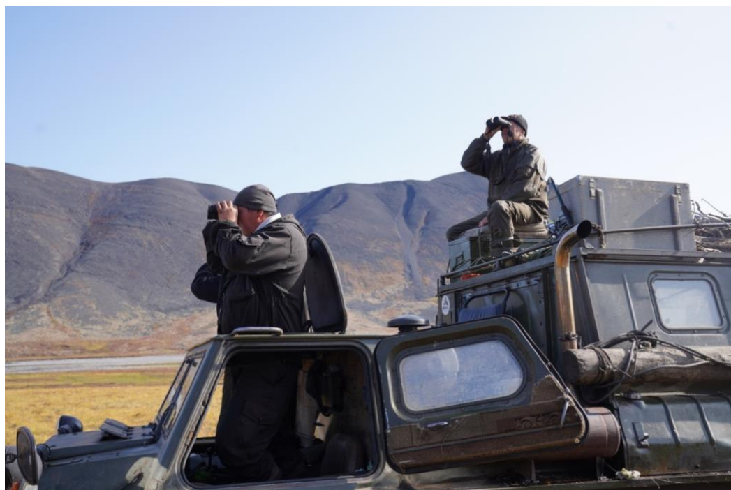
Рис. 3. Учёт снежного барана на маршруте с использованием вездехода.

Основной объём учётных данных был получен при проведении маршрутных учётов с помощью вездеходов (рис. 3).