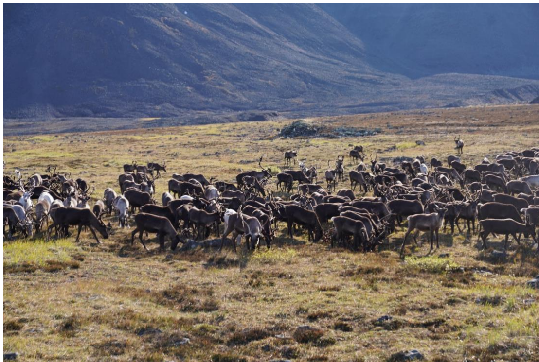
Рис.15. Домашние северные олени в межгорной долине.

скудная или отсутствует. Видимо, данная территория не вполне пригодна для обитания снежного барана. Кроме того, в межгорных долинах южной части хребта осуществляется выпас домашних северных оленей, что может быть дополнительной причиной, по которой снежные барана избегают данную территорию (рис.15).