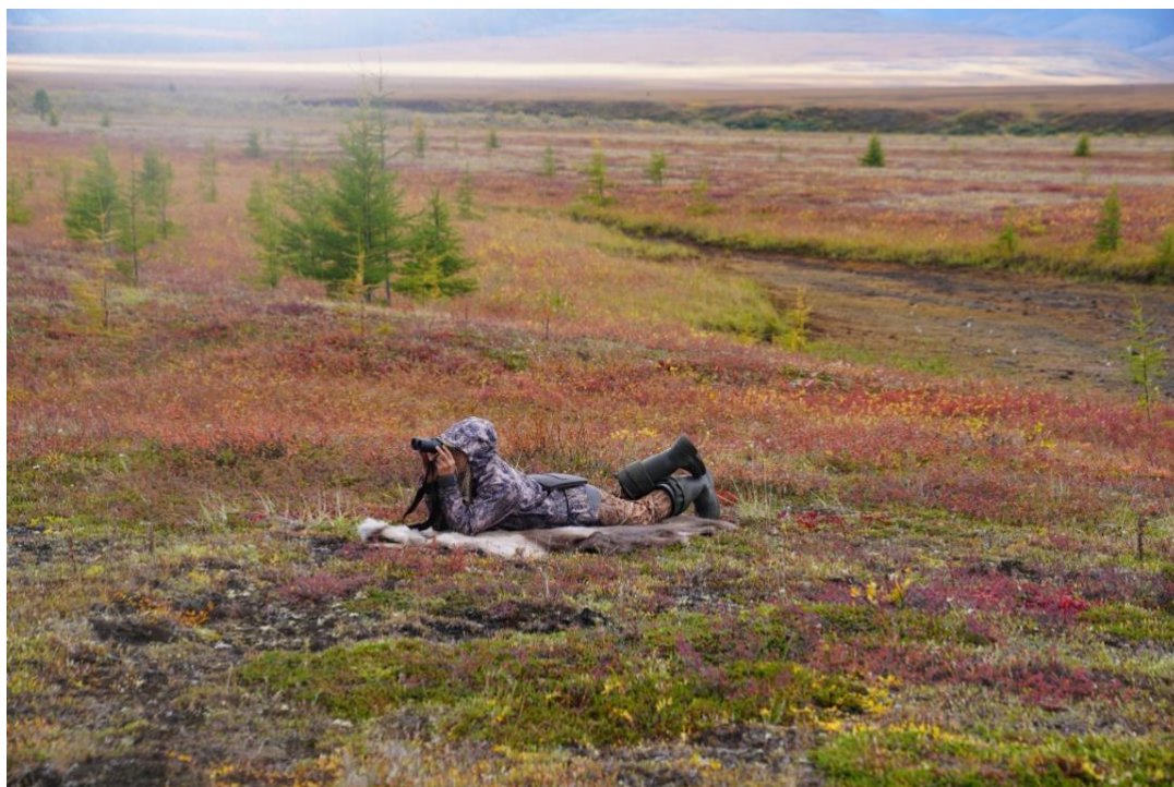
Рис. 2. Учёт снежного барана с наблюдательной точки на модельной площадке Сасыр.

Учёт снежных баранов на модельных площадках с наблюдательных точек производился в местах расположения лагерей – на Сасыре, Угдаме и Ньюосу (указаны названия рек, рядом с которыми находились лагеря). На Сасыре и Угдаме наблюдательные точки были приурочены к местам отлова снежного барана (рис.2).