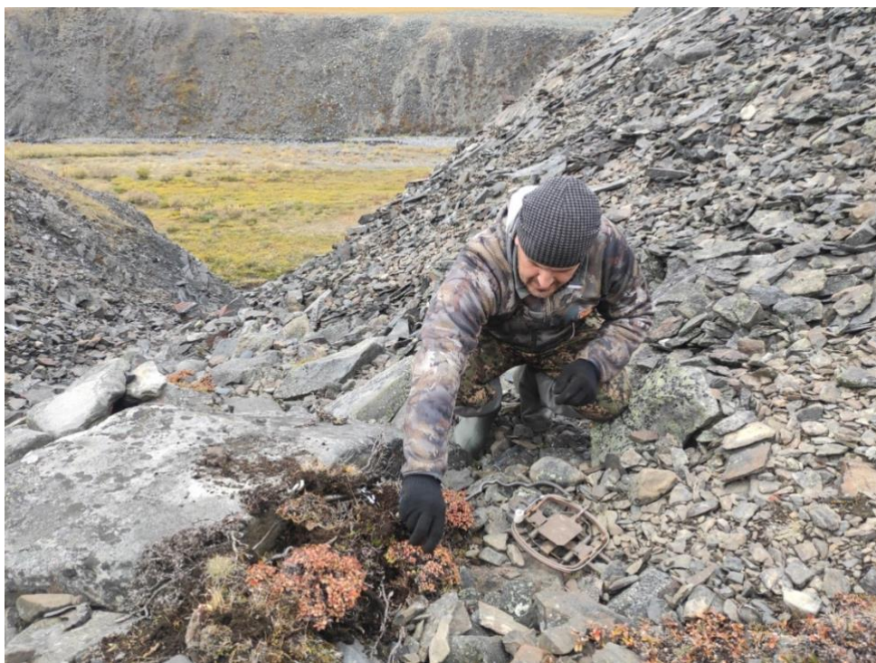
Рис. 5. Установка ловушки на тропе.

камню (рис.5). Также при установке применялся перфоратор для сверления отверстия в камне, после чего вставлялся анкер с ушком для крепления верёвки (рис.6).