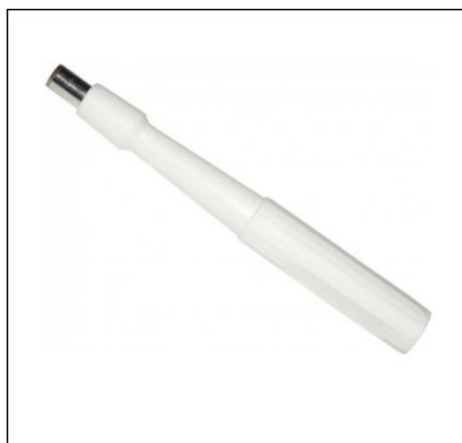
Рис. 10. Инструмент для биопсии кожи.

Одновременно с мечением производился сбор образцов биоматериала для генетического анализа. В ушную раковину отловленного животного путем надавливания с прокручиванием вводился инструмент для биопсии кожи d=5 мм (рис.10). Таким образом, отделялся кусочек кожи (образец), который помещался в пробирку с этиловым спиртом.