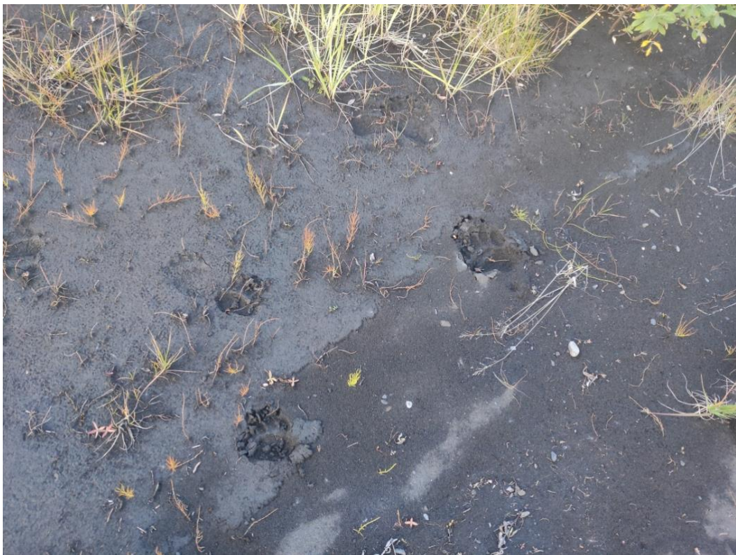
Рис.21. Следы медведицы и медвежат.

Из других хищников, представляющих угрозу для снежного барана, отметим росомаху. По опросным сведениям в местах обитания снежного