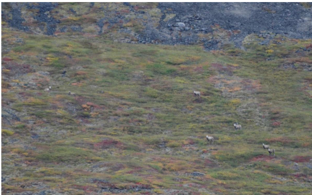
Рис. 13. Группа взрослых самок снежного барана, учётная на маршруте с вездехода.

Применение транспорта эффективно в том случае, когда через километр-два делаются остановки и производится осмотр территории. Такой приём позволяет значительно повысить точность учёта.