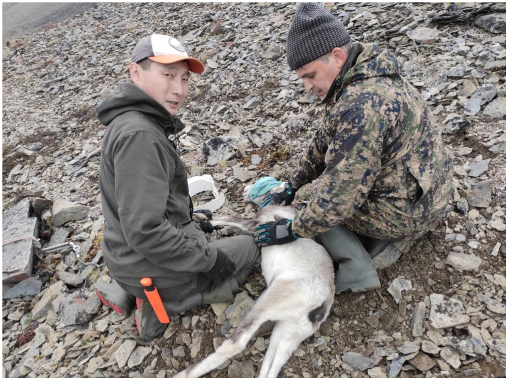
Рис.19. Отловленный ягнёнок снежного барана.